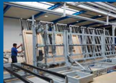
... Übergabe in die nächste Fertigungslinie